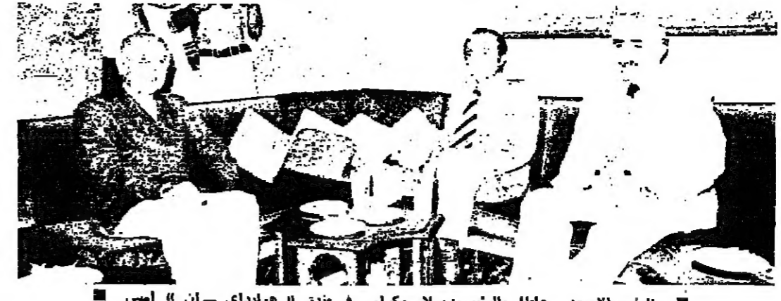
الرئيس اسعد محاطاً بالرئيسين سلام وكرامي في مكتب « هولدياي » امس

انتقلت الازمة الازمة الوزارة من مرحلة العزل الى مرحلة الاسعد والمطلب الوطينة ، وضرورة الاتفاق حول هذه القضايا قبل تشكيل الحكومة . وقد خرج الرئيس اسعد وكرامي وسلام متضائلين بالنسبة للمرحلة الجديدة التي تطهها الازمة .